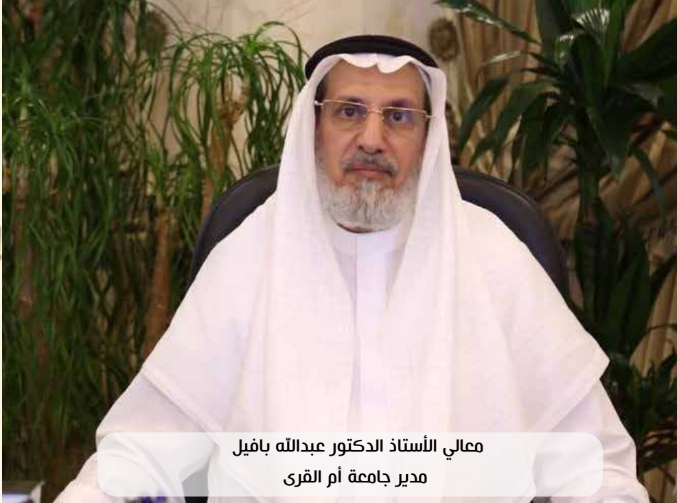
معالي الأستاذ الدكتور عبدالله بافيل مدير جامعة أم القرى