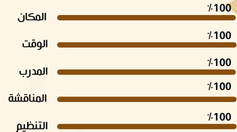
نسبة الرضا في دورة إدارة السلوك في المخاطر