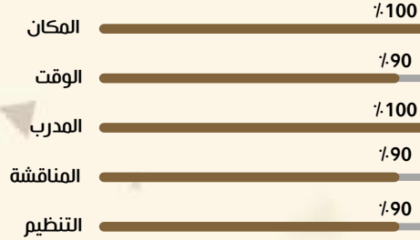
نسبة الرضا في دورة أمن المعلومات